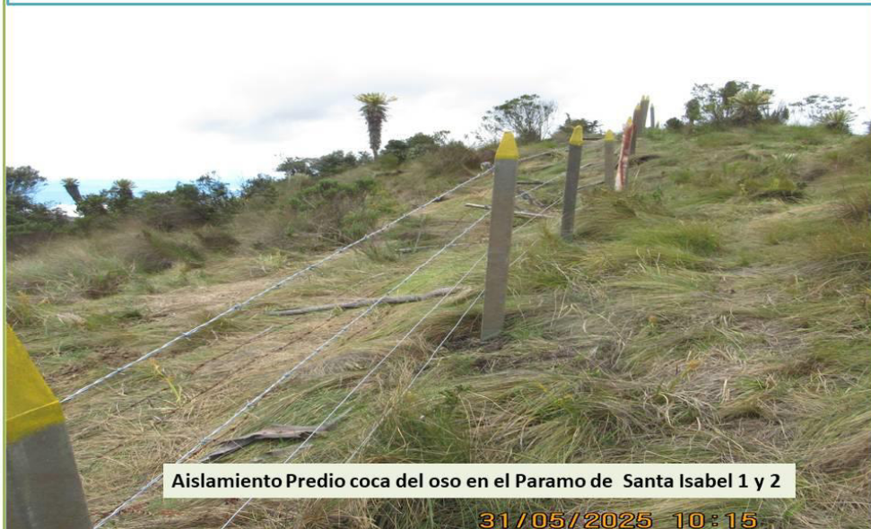
Aislamiento Predio coca del oso en el Paramo de Santa Isabel 1 y 2