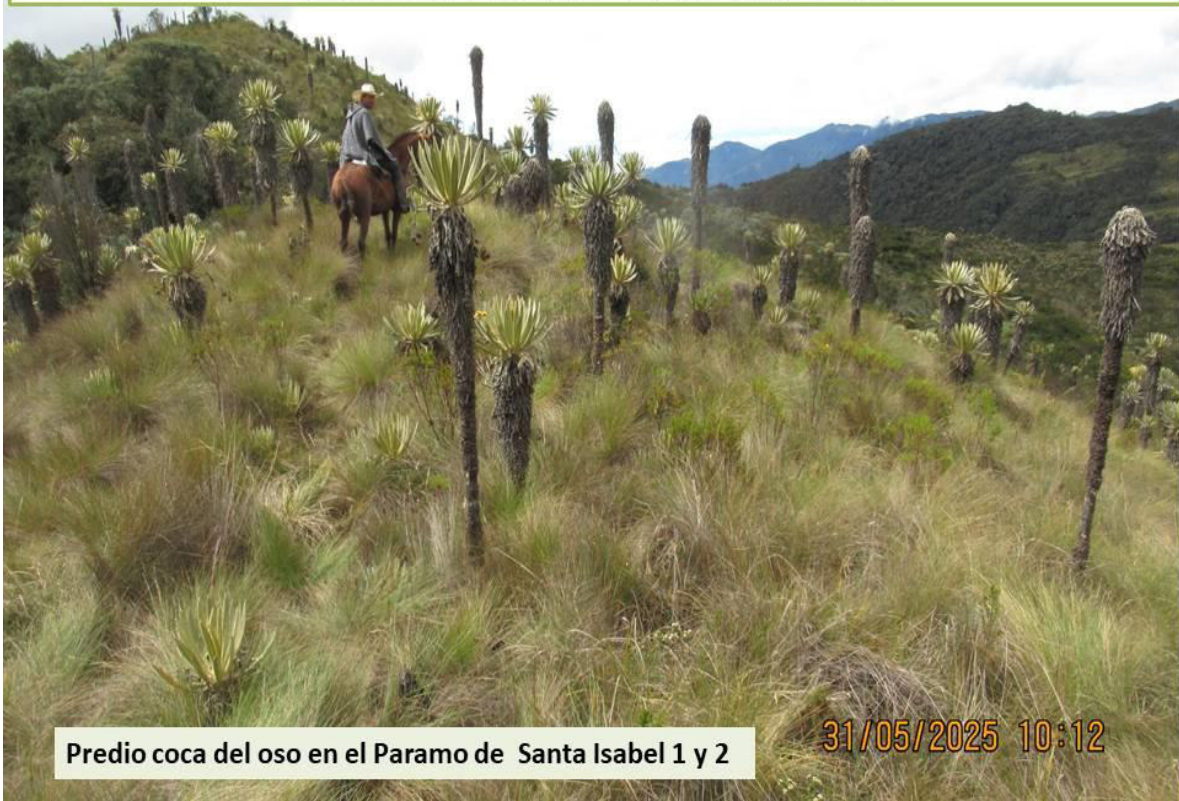
Foto N° 2. Pago de servicios ambientales PSA ,entre la Gobernación del Tolima y CORCUENCA CONVENIO- N°1981-junio 5 2023

Predio coca del oso en el Paramo de Santa Isabel 1 y 2